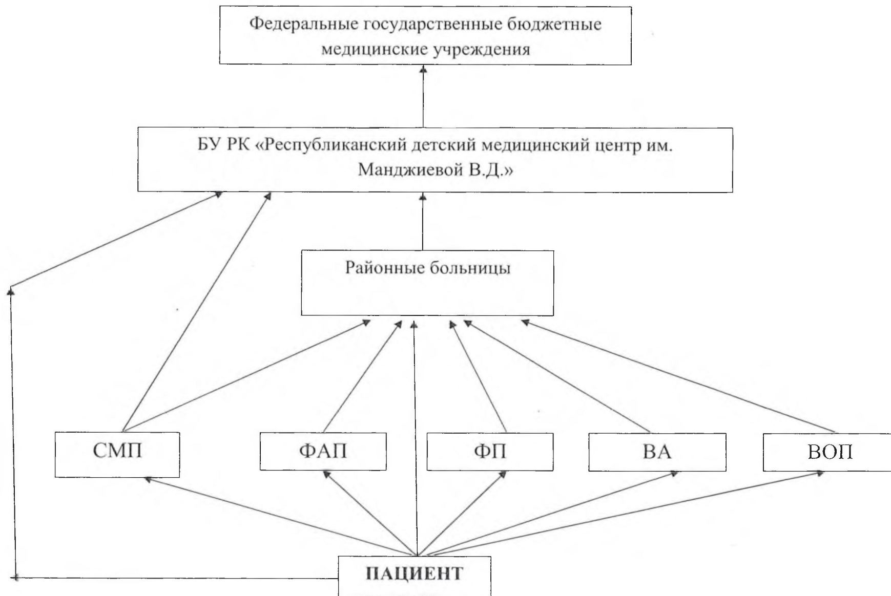
Схема маршрутизации детей по профилю «пульмонология» на территории Республики Калмыкия